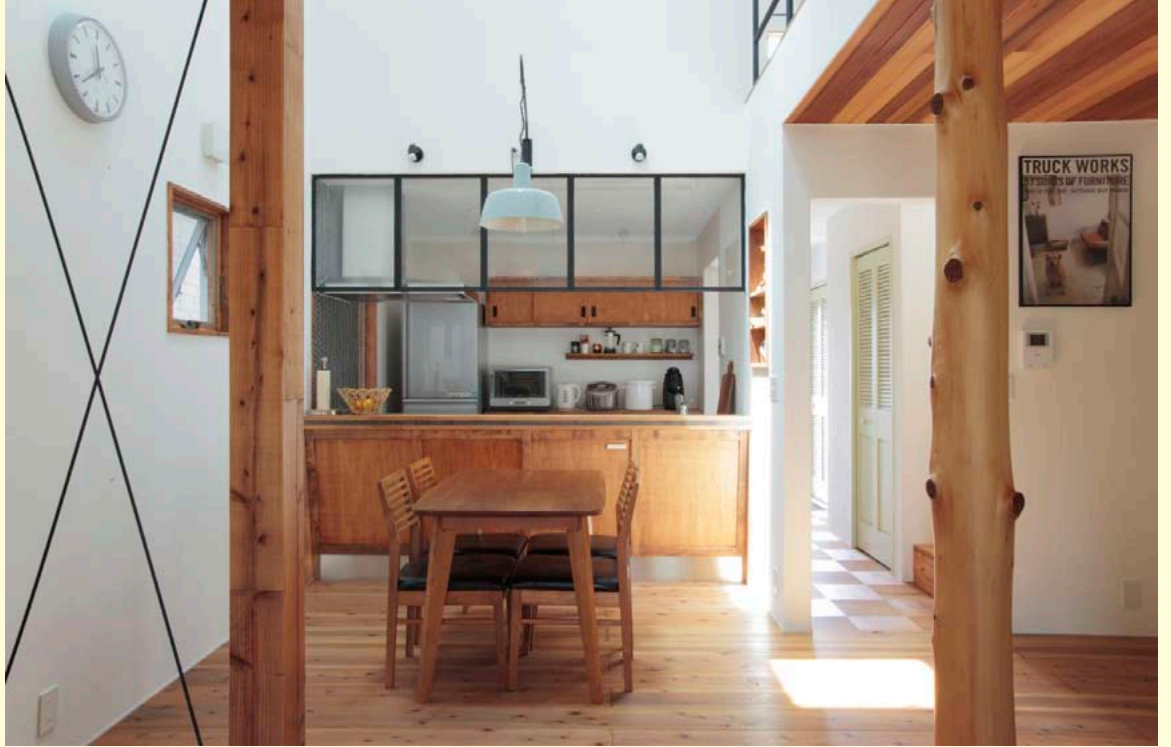
ウッドの中に配したブラックフレームが空間を引き締める効果あり。ナチュラルさをほどよくシャープに見せているのがおしゃれ。

ワークスペースへと続く扉は、空間にマッチするペールトーンのグリーンに。ウォークインクローゼットとのカラーコントラストも◎。