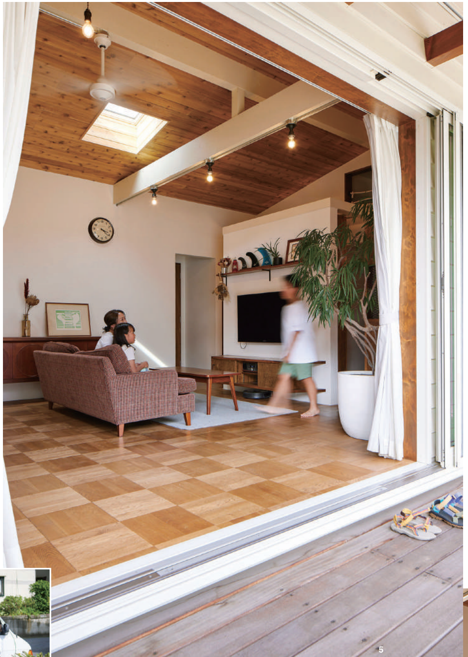
5 / フルサッシを引き込むと、大開口を通じてリビングとカバードポーチが一体化。床の高さをフラットにそろえて行き来しやすくなっている 6 / 駐車場は土間の目の前に設け、アウトドア用品を運びやすい動線に 7 / カバードポーチの直射日光が当たらないところで長女と妻がメダカを飼育。元気に育て水槽スペース拡張中