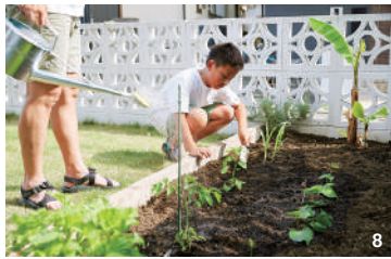
8 / 日当たりのいい庭の一角に家庭菜園を設置。水やりや手入れは長男と父が担当 9 / 外遊びで汚れたものをいつでも洗って干せる物干し部屋。勝手口から庭に直接出られ、通気面もパッチリ